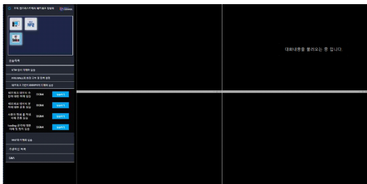
Fig. 2. UI design(company B)

또한, 학습자의 실수(학습 경로를 잘못 들어하거나 과제수행을 반복적으로 실패 등)를 교정해 주는 장치를 마련할 필요가 있다. 학습자가 자주 실패하거나 학습을 중단하는 지점을 파악하여 필요한 정보나 힌트를 적재적소에서 제공하고 학습이 진행됨에 따라 정보와 힌트를 점진적으로 축소하여 문제해결 능력을 키우는 동시에 훈련과정 완주를 촉진할 수 있다. 이상의 모의평가를 통해 A사와 B사의 학습 플랫폼에서 개선 및 기능 강화가 요구되는 사항은 Table 4