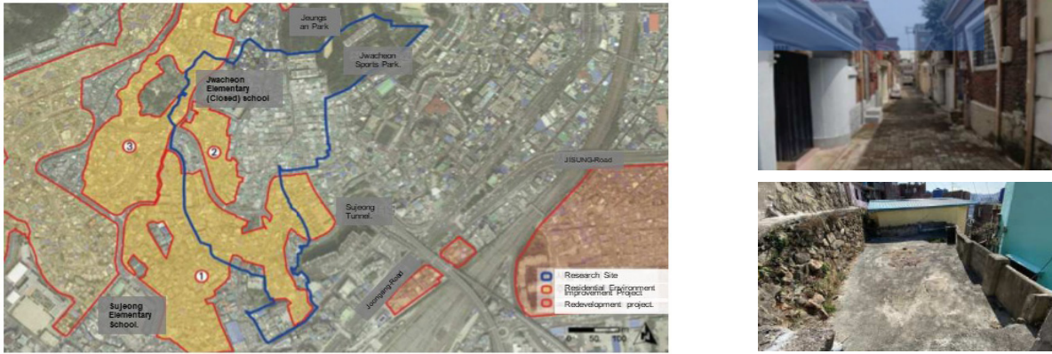
Fig. 1. Research Site

연계성 등을 고려하지 않고 단순 해양관광단지를 만드는데에만 초점이 맞춰짐으로 인해, 추후 인접 지역간에 경관적 괴리감이 점점 더 커질 것으로 우려된다(Fig. 1).