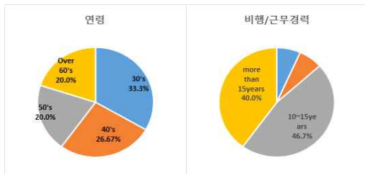
Fig. 1. Age and work experience of survey participants

Fig. 2의 설문 응답에 의하면, ‘국내 모의비행훈련장치 제도의 문제가 있는가’라는 질문에 대해 ‘매우 그렇다’와 ‘그렇다’가 14명(93%)으로 대다수의 설문 인원이 모의비행훈련장치 제도에 문제가 있다고 응답하였