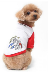
Fig. 3. CASTELBAJAC. www.mall.castelbajac.com