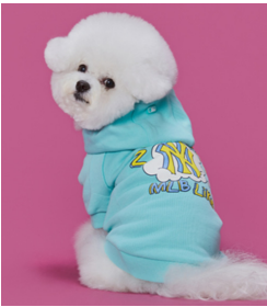
Fig. 11. MLB. www.mlb-korea.com