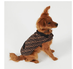
Fig. 20. FENDI. www.fendi.com