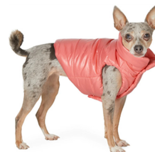
Fig. 24. Moncler Genius. www.ssense.com