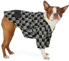
Fig. 6. Welldone. www.ssense.com