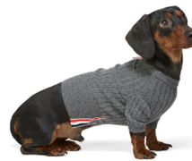
Fig. 19. Thom Browne. www.ssense.com