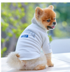
Fig. 1. PHIZCREW. www.mk.co.kr

본 연구에서는 무늬를 크게 상징 무늬, 사실적 무늬, 추상적 무늬, 기하학적 무늬의 네 가지로 구분하였다. 상징 무늬는 브랜드의 시그니처 로고나 브랜드명이 그려진 것으로 13개의 제품이 이에 해당해 가장 많은 수를 차지했다(Fig. 1, 2, 3, 6, 11,