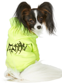
Fig. 13. MISBHV.