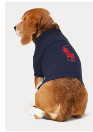
Fig. 14. Ralph Lauren.