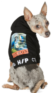
Fig. 21. Heron Preston.