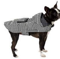
Fig. 9. Kate Spade.