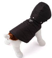
Fig. 25. PRADA. www.prada.com