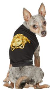
Fig. 22. Versace. www.ssense.com