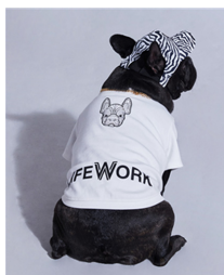
Fig. 2. Lifework. www.lifeworkstore.co.kr