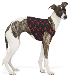
Fig. 23. Marine Serre.