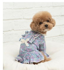
Fig. 4. Miminko. www.miminko.kr