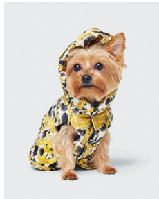
Fig. 17. H&M X Moschino.