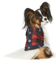
Fig. 16. Dsquared2.