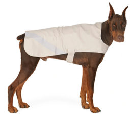
Fig. 15. Stutterheim.