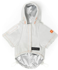
Fig. 12. Heron Preston X V.I.P.(Very Important Puppie). www.veryimportantpuppies.dog