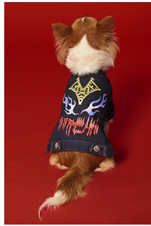
Fig. 8. DIESEL. www.global.diesel.com