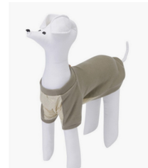
Fig. 5. PENNECT. www.kolonmall.com