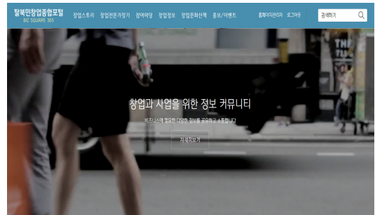
그림 1. 초기버전 홈페이지

이를 기반으로 총 여섯 가지 탭기능으로 단순화하였는데 이는 창업스토리, 창업전문가찾기, 참여마당, 창업정보, 창업문화산책, 홍보/이벤트로 압축할 수 있었다.