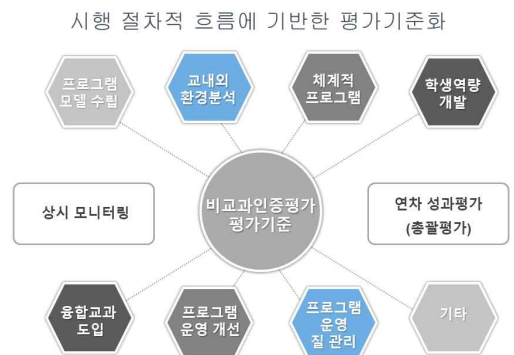
그림 3. 비교과프로그램 품질관리 인증평가제 평가 기준 Figure 3. The evaluation criteria for certification evaluation system for quality management of extracurricular programs

비교과프로그램의 품질관리를 위한 인증평가제 평가 기준은 연구 방법에서 밝힌 바와 같이 두 편의 선행 문헌([2][8])에서 제시한 기준 및 세부 요소들을 참조하여 마련되었다. 먼저, 비교과프로그램 품질관리 인증평가제 평가 기준의 개요는 그림 3과 같다.