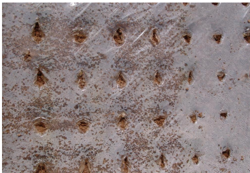
Fig. 2. (b) Condition after sowing

파종 실험은 전남 무안군에 위치한 국립원예특작과학원 채소과 시험포장에서 실시하였으며, 요인실험에서 최적조건으로 판단되는 조건을 설정한 후 실험을 진행하였