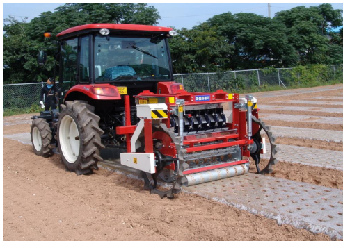
Fig. 2. (a) State of sowing performance test