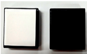
Fig. 3. White and Black Standard Tile.

분광광도계(Spectrophotometer CM-3600A, Konica Minolta, Japan)장비를 이용하여 흑색표준타일(L*(D65)=3.63, a*(D65)=-1.47, b*(D65)=-1.12) 과 백색표준타일(L*(D65)=93.77, a*(D65)=-0.28, b*(D65)=2.58) 으로 흑색표준타일과 백색표준타일 위에 시편을 놓고, 표준광원 D65의 조건에서 정 반사광 제거방식으로 시편을 각각 측정하였다. 시편 당 총 3번씩 반복측정하였다(Fig. 3).