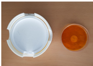
Fig. 1. Coloring methods

이물질이 들어가지 않도록 뚜껑이 있는 용기에 착색 용액인 2종의 Color Liquid를 담고, 비금속성 재료인