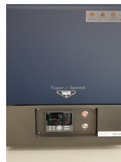
Fig. 2. Electric Furnace (Tiger-Speed SK12(GB-01))