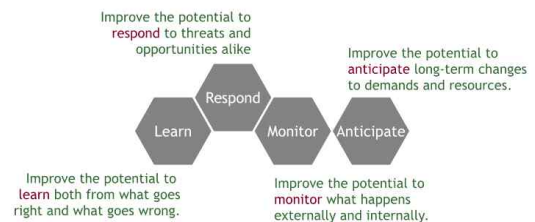
Fig. 1. Four resilience potentials(Hollnagel, 2015)

마지막으로, 예측(anticipate) 역량은 환경변화에 따른 새로운 기회 및 운영 조건 변경 등의 시스템의 미래변화를 예상하는 예측 능력으로써, 시스템에 긍정적이든 부정적이든 기능에 영향을 줄 수 있는 미래의 환경, 조건, 변화를 찾아내는 것이다. 즉, 무엇을 기대할 수 있는지 알고 찾아내는 것이다.