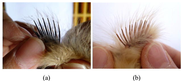
Fig. 1. Wing feather pattern of early-feathering chick (a) and late-feathering chick (b) at one-day old.

한국재래닭 적갈색종 557수를 대상으로 기초 집단 내 깃털 형태에 따른 조우성과 만우성 개체를 식별하였고(Fig. 1), 조우성과 만우성 개체의 분포 현황과 유전자 및 유전자형 빈도를 추정하여 이의 결과를 Table 1에 제시하였다. 조사 결과, 본 집단 내 조우성 개체가 429수(77%), 만우성 개체가 128수(23%)로 확인되어 만우성보다 조우성 개체의 빈도가 높게 나타났다. 또한 본 집단이 Hardy-Weinberg 평형상태에 있다는 가정하에 유전자 빈도를 추정한 결과, 수컷의 조우성유전자( k ) 빈도는 0.784, 만우성 유전자( K ) 빈도는 0.216으로 추정된 반면, 암컷에서는 조우성유전자 빈도가 0.824, 만우성유전자 빈도가 0.176으로 추정되어 수컷 집단 내 만우성유전자 빈도가 암컷 집단에 비해 다소 높게 나타났다. 이를 토대로 본 집단 내 전체 조만성유전자 빈도를 계산한 결과, 조우성유전자( k )의 빈도는 0.814, 만우성유전자( K )의 빈도는 0.186으로 추정되었다. 국내에서 사육하는 품종들의 집단 내 깃털 조만성의 분포 양상과 유전자 빈도에 관한 연구에서 Sohn et al.(2012)은 국가 보존 유전자원 토종닭 10품종을 대상으로 깃털 조만성의 분포 양상을 조사한 결과, 토종 흑색코니시종, 토종 로드아일랜드레드종 및 한국재래닭 적갈색종에만 조우성과 만우성 개체들이 혼재되어 있고, 토종 갈색코니시종, 백색레그혼종, 오폭종, 재래황갈종, 재래회색종, 재래백색종 및 재래흑색종은 집단 내 조우성 개체만 존재한다고 보고하였다. 더불어 한국재래닭 적갈색종의