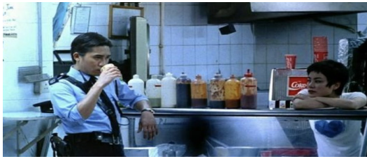
Fig. 5. In the movie Chungking Express, the police drinking coffee in front of a fast food.

영화<중경삼림>에는 패스트푸드점 앞에 선 커피를 마시는 경찰 양조위가 등장 하는데, 조명의 변화와 함께 빠르게 오가는 블러 이미지의 인파 속에서 홀로 가만히 커피를 마시는 모습을 통해 실연으로 마음을 추스리지 못 하는 그의 불안한 정서를 표현하고 있다.