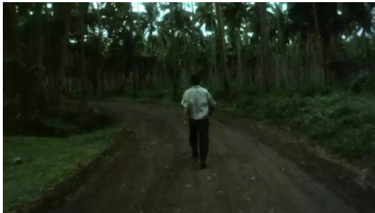
Fig. 8. In the movie "Days of Being Wild," the protagonist walks sadly along the road.

순백의 고결함 등이 모두 그러하다. 이들 영화 언어는 동양의 전통문화가 강조하는 사람과 자연의 조화를 구현하며, 감정과 풍경이 한데 어우러진 영상을 통해 오랜 정서와 시적 정취의 감흥을 불러 일으킨다. 둘째, 카메라 워크 측면에서 보면, 두 감독의 영화는 롱 테이크와 슬로우 모션을 즐겨 사용한다. 이러한 장면은 관객에게 동양적 정서, 시적 정취의 심미적 경험을 제공할 뿐 아니라 고전 문화에 대한 관객의 인문적 향수와 역사적 추억을 떠올리게 한다.