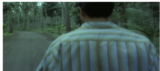
Fig. 1. In the movie "Days of Being Wild", the hero walks down the road.

날마다 수많은 사람을 스쳐 지나가지만, 대면 및 소통은 일어나지 않는, 가깝지만 먼 사람들의 모습, 타인들과의 감정적 거리라는 정서를 이와 같은 카메라 워크로 표현하고 있다.