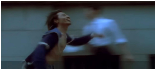
Fig. 3. In the movie Swallowtail Butterfly, the main character Pei Hong was released from prison and later ran down the boulevard.

또 다른 예는 영화<스왈로우테일 버터플라이>에서 주인공 페이홍이 감옥에서 풀려나는 장면에서 볼 수 있는데 마치 자유롭게 비상하는 새처럼 대로를 질주 할 때, 역시 흔들리며 나아가는 카메라 워킹을 통해 페이홍의 기쁨에 찬 내면을 표현하고 있다. 영화에서 흔들리는 카메라 워킹은 관객에게 주인공이 달리는 리듬감, 춤추는 동작의 오르내림을 고스란히 느끼게 하는데 마치 우즈키가 계단을 오를 때 화면이 그녀의 발걸음을 따라 폴짝뛰며 흔들리듯,