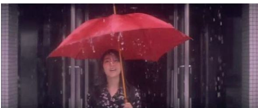
Fig. 9. In the movie April Story, the heroine runs in the rain with a red umbrella.

예를 들어 영화<아비정진>에서 사용된 많은 롱테이크 중, 남주인공 아비가 생모를 만나지 못한 채 격앙되어 떠나는 장면에서 카메라는 긴 호흡으로 아비의 뒷모습을 따라간다. 열대식물이 뻣뻣하게 늘어선 길을 따라 걷는 아비의 모습은 그의 미련 없는 결연함과 깊은 상처를 느끼게 해준다. 카메라는 의도적으로 줄곧 그의 뒷모습을 따라가며 그의 들쭉이고 흔들리는 움직임을 슬로우 모션으로 보여 준다. 이를 통해 결국 생모를 찾지 못한 실망감, 세상의 냉담함에 대한 서운함을 표현하고 있다. 이wai이순지 감독 역시 정서적 분위기를 표현하는 데 서정적인 롱테이크를 자주 사용한다. 거기에 더해 로우 앵글에서 서서히 위로 올라가는 장면은 보는 이로 하여금 깊은 감정적 공감을 유발케 한다[12].