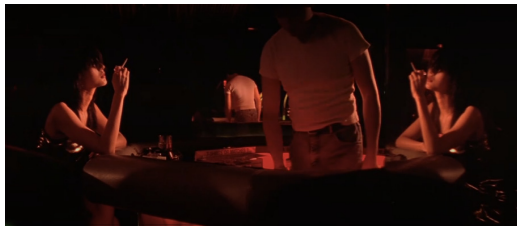
Fig. 6. In the movie Fallen Angels, i sit quietly on a bar of lice and drink.

영화<중경삼림>에는 패스트푸드점 앞에 선 커피를 마시는 경찰 양조위가 등장 하는데, 조명의 변화와 함께 빠르게 오가는 블러 이미지의 인파 속에서 홀로 가만히 커피를 마시는 모습을 통해 실연으로 마음을 추스리지 못 하는 그의 불안한 정서를 표현하고 있다.