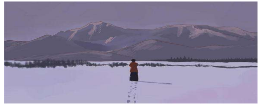
Fig. 10. In the movie Love Letter, the girl walks in the snow.

영화 <러브레터>의 첫 장면에서 히로코가 눈발을 걷는 롱 테이크 쇼트, <4월 이야기>에서 우즈키가 붉은 우산을 편 채 빗 속을 달리는 장면 등이 그러하다. 소박한 일상의 특징을 보여주며, 맑은 여백 속에 심오한 운치와 전형적인 동양적 격조를 담아내고 있다고 할 수 있다. 이상의 분석을 통해, 왕가위와 이wai이순지의 영화에 구현된 동양 영화의 미학적 특징의 유사성을 살펴볼 수 있었으며, 이는 두 감독을 비교 연구한 출발점이기도 하다[13].