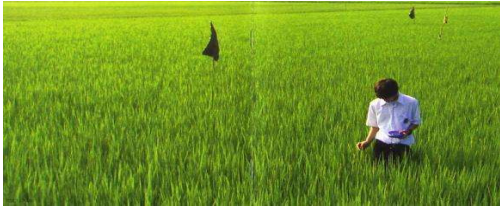
Fig. 2. In the movie "All About Lily Chou-Chou," the main character stands in a wheat field.

영화는 시작하자마자 주인공 유이치가 밀밭에 홀로 선 채 음악을 듣는 롱테이크에, 검은 바탕과 흰색 글씨로 된 BBS 게시판을 끊임없이 삽입하여 단일한 화면의 지속시간을 더 짧게 만들고, 핸드헬드 기법으로 흔들리는 화면을 통해 지리멸렬한 영상효과를 만들어낸다. 유이치와 호시노 일행이 오키나와로 여행을 간 장면에서는 주변 몇 명이 장난을 치는 장면은 안정적인 쇼트로 보여주는 동시에 유이치 일행이 자신의 DV로 촬영하는 흔들리는 장면을 교차 편집하였는데, 이러한 대비되는 성격의 쇼트들의 교차편집으로 인해 이 장면은 대단히 불안정하게 표현되며 핸드헬드의 흔들림 효과를 극대화시켜준다.