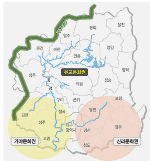
<그림 1> 경북 3대 문화권 지도

그 가시적 흔적과 내장된 기억인 유무형 문화재는 <표 10>에서 서울을 제외하면 전국에서 가장 많다(문화재청, 2019). 문화자본 및 관광자원으로 각광받고 있다. 이러한 경북의 문화유산적 특성을 <그림 1>과 같이 3대 문화권으로 대별하여 분석하면 다음과 같다.