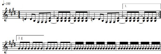
Fig. 4. Over Action Man

다섯 번째 작품인 오버액션맨은 연인에 대한 집착에 대해 표현하고 있다. 거만하고 가부장적 남성이 연인을 향한 집착을 bpm100의 록과 테크노의 결합으로 연주하고 있다. 아래의 8번째 마디의 8분음표에서 16분음표로 변환되는 시점을 음표라기보다는 의도적 버퍼링과 결합된 테크니컬 싸인(sign) 정도로 보여지며, 이것은 분위기를 고조화 하기 위해 음향감과 볼륨감, 방향감의 반복 연주를 함으로써 마치 집착과 연인을 다그치는 듯한 분위기를 자아내고 있다[9].