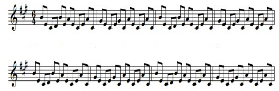
Fig. 3. Friends

세 번째 트랙인 Friends는 스네어 더블스트로크와 악센트를 적절하게 프로그래밍하여, 실제 드럼연주와 같이 구현한 작품이다. 어쿠스틱 기타와 피아노, 스트링의 순차적인 개입으로 진행되는 20마디의 긴 전주는 작품의 공간감을 점점 확장시키고 있으며, 프로그레시브적인 요소를 담고 있는 작품이다.