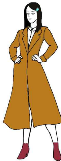
Fig. 2. Example of Naoko's style

특히, 미도리와 ‘선글라스’, ‘미니스커트’가 비교적 강한 연결을 보였으며, 해당 키워드는 외모 키워드인 ‘날씬한’, ‘밝은’과 연결되었다. 선글라스와 미니스커트는 미도리의 날씬한 외형과 밝은 성격을 반영하는 의상 장치인 것을 확인할 수 있었다.