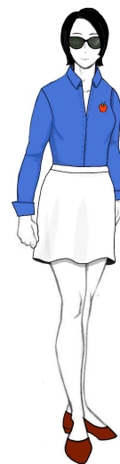
Fig. 3. Example of Midori's style

반면, 레이코와 와타나베는 ‘셔츠’, ‘팬츠’와 각각 가장 큰 연결강도를 보였으나, 극 중 두 인물의 의상이 평범하게 묘사되는 탓에 의상과 성격 특성을 구분 짓는 단어들 이 특징적으로 연결을 보이지 않았다. 레이코의 의상은 약 5회에 걸쳐 언급되는데, 남성용 트위드 재킷이나 테니스화, 여러 종류의 바지를 통해 중성적이고 활동적인 스