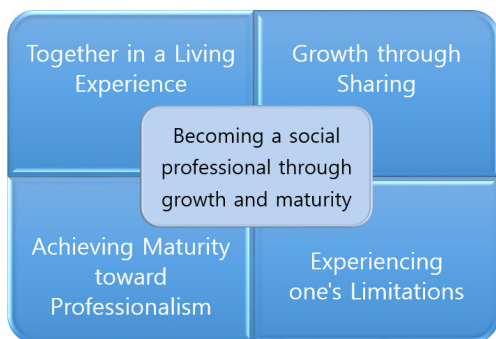
Fig. 2. College Students' Experiences on Community Service

참가자들은 대상자와의 대화 시에 어떻게 관계를 형성하고 풀어나가야 할지 어려움을 느끼기도 하였고, 봉사활동 시 자신의 지식과 경험으로 해결 할 수 없는 난감한 상황에 직면하기도 하였다. 이러한 상황에서는 함께 한 친구들의 도움을 받아 해결하기도 하였고, 다행히 교수자와 함께하는 봉사활동의 경우는 보다 전문적인 도움을 받아 해결할 수 있었다.