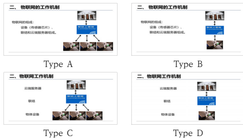
Fig. 1. Four Types of Lecture Video

본 연구에 사용된 동영상은 대학 강의 동영상의 가장 일반적인 유형인 슬라이드 프레젠테이션과 교수자 내레이션이 함께 제시되는 형태를 선정하였다. 그리고 동영상의 학습 주제는 교양강좌인 정보기술개론에서 다루는 사물인터넷으로, 슬라이드의 구조는 Garner 등(2009)의 슬라이드 구조 중 상위주제와 하위주제 및 이미지의 구조를 선택하였다[2]. 텍스트 제시방식은 교수자 내레이션의 주요 아이디어를 간단하고 짧은 텍스트로 제시하는 방식과 키워드 제시방식으로 구분하였다[6, 7].