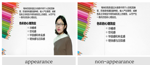
Fig. 2. Lecturer's Videos

그 후 각 영상의 발화속도를 다음과 같이 측정하였다. 빠른 발화속도의 동영상 재생시간 중 무작위로 1분 분량의 세 구간을 선택하였다. 각 구간에서 교수자가 말하는 총 글자 수를 계산한 결과 각각 247자, 243자, 230자로 1분당 평균 240자로 나타났다. 같은 방법으로 느린 발화속도의 동영상에서 계산한 결과 각각 163자, 199자, 174자로 1분당 평균 179자로 나타났다. 각 동영상의 재생시간은 빠른 발화속도의 동영상은 5분 17초, 느린 발화속도의 동영상은 7분 05초로 나타났다.