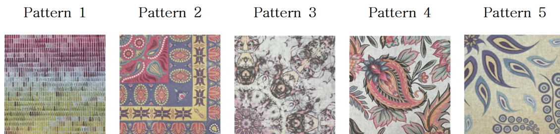
Fig. 3. Various pattern fabric of naturally-derived DTP textile products.

4, 5 시료를 앞서 언급된 전처리 방법을 통한 지표물질 함량의 결과를 Table 6에 도시하였다. Pattern 1은 노란색 잉크에 사용된 강황의 지표물질인 Curcumin이 41.36 mg/L로 가장 높은 함량으로 검출 되었으며 Demethoxycurcumin 4.98 mg/L, bis-Demethoxycurcumin가 3.41 mg/L 또한 높은 함량을 보였다. 청색 잉크에 사용된 쪽의 지표물질인 Indigo가 24.19 mg/L와 Indirubin가 0.24 mg/L이 검출 되었다. 쪽 염료는 추출방법 및 원산지 등에 의한 지표물질의 함량 비율 차이가 비교적 큰 것으로 알려져 있다.(Oh, 2010) 본 논문에서는 Cyan 색상을 위하여 자주색을 띄는 Indirubin 보다 파란계열을 띄는 Indigo의