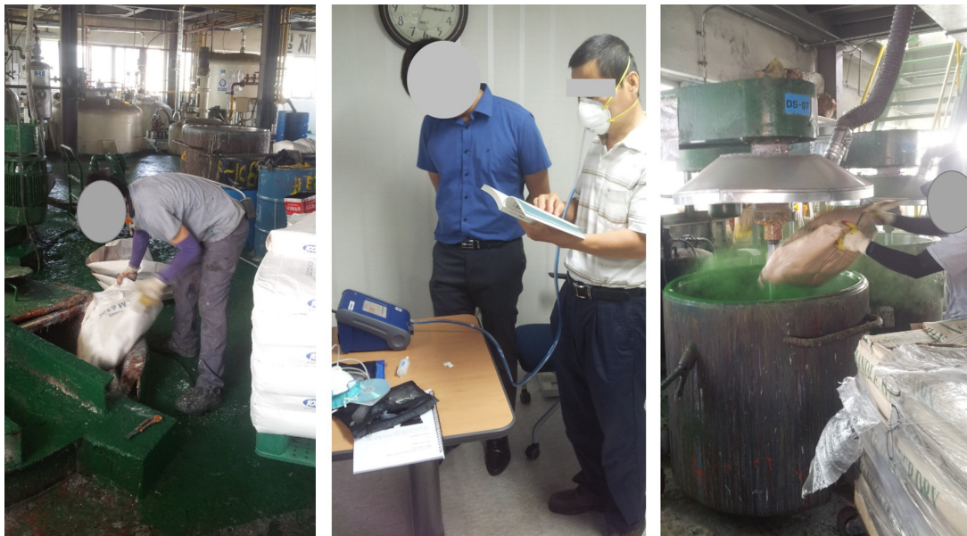
Figure 1. Talc pouring and mixing work (left), fit test (center), pigment pouring and mixing (right)

호흡성 분진의 측정과 분석은 NIOSH 0600 방법에 따라 사이클론(4.2 L/min, GK2.69; BGI Inc., Waltham, MA, USA)이 체결된 직경 37 mm PVC (polyvinyl chloride) 여과지(SKI Inc., Eighty Four, PA, USA)에 호흡성 분진을 채취한 후 해독도 1 \mu\text{g}/\text{m}^3