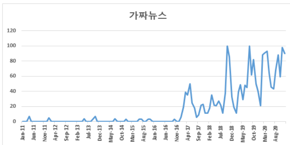
<그림 1> 2010-2020년 가짜뉴스의 증가추세(구글트렌드)

최근 가짜뉴스의 증가는 수치에 대한 정확한 계산을 확인하지 않고도 느껴질 정도로 급격히 확산하고 있다(<그림 1> 참조).