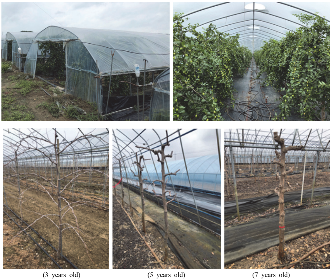
Figure 1. Horticultural plastic house and tree shapes depending on tree age of 'Hwangsil' jujube tree.

경테이프를 이용하여 측정하였다. 수관폭은 동-서(E-W) 방향과 남-북(S-N)방향의 4방위를 줄자로 측정하였다. 지지수는 주간(원줄기; stem)에서 발생되어 수형을 구성하고 있는 가지의 수를 조사하였다.