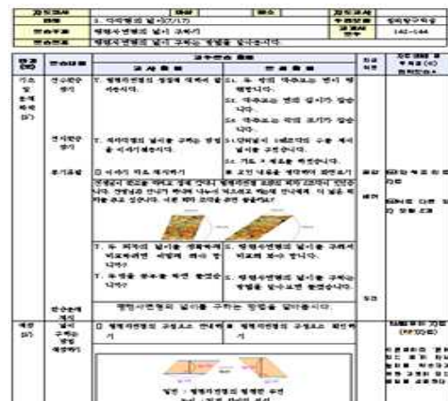
그림 2. 대면 수업지도안

지도안 분석하기 과제는 현직 교사가 작성한 두 편의 수업지도안을 비판적으로 분석하는 것이었다. 두 수업지도안 중 하나는 5학년 수학과 대면수업을 위해 작성된 것으로 ‘다각형의 넓이’ 단원의 ‘평행사변형 넓이 구하기’를 주제로 한 것이었다. 그림 2는 본 연구의 분석활동을 위해 사용된 대면 수업지도안의 일부를 나타낸 것이다.