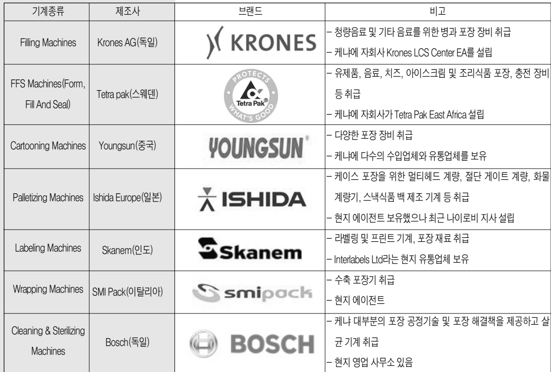
[표 3] 케냐의 대표적 포장기계 판매회사

[자료 : 2018 Packaging machinery importers, various packaging machinery report]