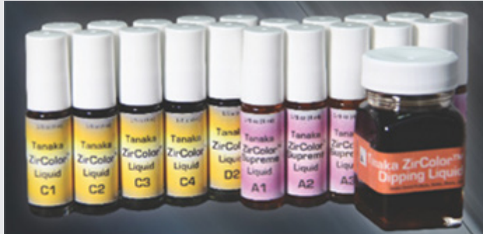
그림 2. 소결 전 지르코니아 착색제

한 3D 프린팅으로 단일구조 지르코니아 수복물을 만드는 시도들이 이루어지고 있는데 13) 3D 프린팅의 특성상 여러 색조의 소재를 이용하게 되면 한 치아 안에서 여러 색조를 표현하는 지르코니아 수복물의 제작이 간단하게 이루어질 수 있을 것으로 기대된다.