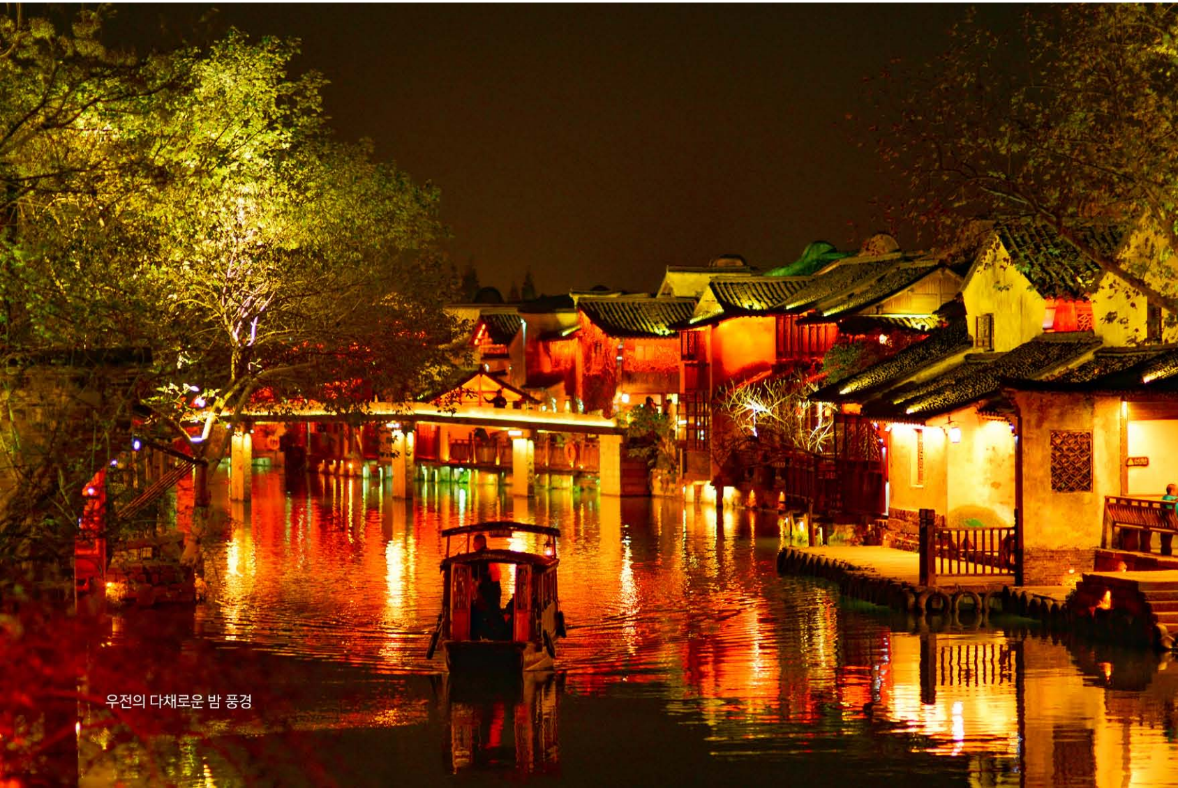
우전의 다채로운 밤 풍경