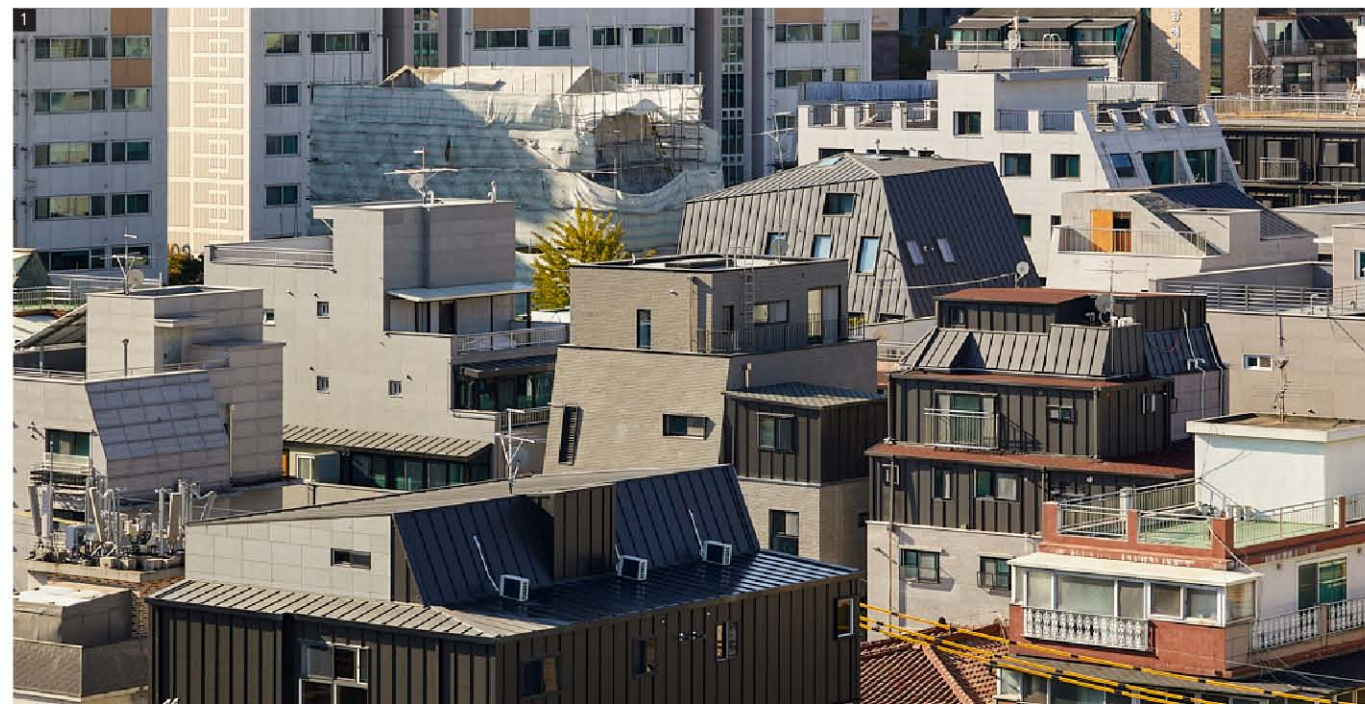
1. 원경 2. 북서측 전경 3. 내부계단 4. 4층 주방 및 거실 5. 5층 내부전경

The three terraced brick mass allows the openness and pausing area in this highly densified and max filled sequence of neighbor.