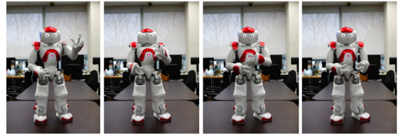
출처 Y. Yoon et al., "Robots learn social skills: End-to-end learning of co-speech gesture generation for humanoid robots," Int. Conf. Robotics Autom. (ICRA), 2019.

고령자케어 로봇을 개발하고 있는 한국전자통신 연구원은 완전한 종단 간 학습 기반의 대인관계 지능 연구들을 수행하고 있다. 참고문헌 [22]에서는 다수의 유튜브 TED 강연 영상을 학습데이터로 사