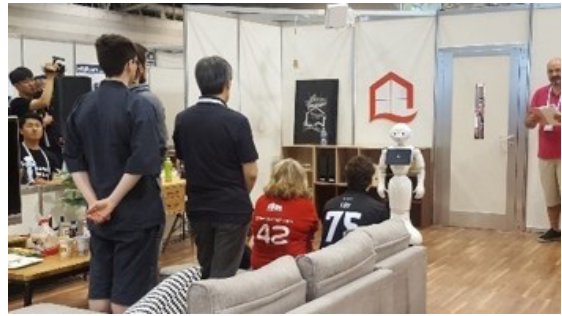
그림 1 RoboCup@Home 챌린지

대표적인 로봇 챌린지인 RoboCup의 리그 중 RoboCup@Home은 2009년부터 현재까지 서비스 로봇의 지능 수준을 비교 평가하기 위해 매년 개최되고 있다[8]. 각 출전팀은 오픈 플랫폼을 이용해 정해진 시나리오에 따라 작업을 수행하며 가장 높은 점수를 얻은 팀이 승리하는 방식이다. 로봇은 불특정 다수를 상대로 복잡하고 다양한 환경에서 주행, 인식, 조작 지능을 조합해 주어진 시나리오를 수행한다(그림 1). RoboCup@Home 2018부터는 오픈 플랫폼에 일본 도요타의 HSR(Human Support Robot)과 소프트뱅크 로보틱스의 Pepper 로봇 플랫