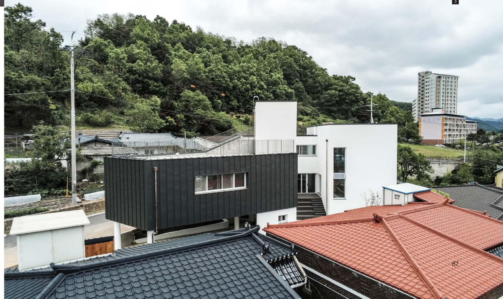
1. 좌측면 전경 2. 전면 전경 3. 후면 전경 4. 1층 다목적홀 5. 계단형 도서관 6. 2층 식당(교육실 겸용) 7. 2층 교육실

Using the various axes and slopes of the triangular site, the entry level is divided into two places and space was formed in skip floor format. There are screens that keep children safe along the road boundaries and the courtyard was built to form a 'ㄷ'-shaped in that space. Skip floor format and the courtyard allow children to walk up and down and wondering around freely as walking along the promenade. The building was designed to be a local children's center where children can enjoy playing, relaxing and learning. To increase the utilization of limited interior space, we designed the interior space for multiple purposes. The outer form of the architecture is that the composition and volume of the interior space are natural from the outside, and designed to be revealed and harmonized. The interior space consists of natural wood and white paint. The exterior landscape and natural lighting were attracted to make it a bright and diverse space. The local children's center in Yeongyang-gun has children who are free to run around and dream of the future. It's a space for. We hope that children who use local children's centers in Yeongyang-gun will enjoy the space and be happy.