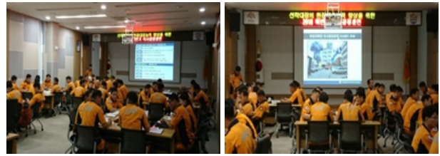
Figure 1. Decision-making training of on-site commanders in chungnam fire service headquarter.

본 연구에서는 소방활동 현장지휘관 대응역량 강화를 위한 핵심역량 설정을 위하여 현장지휘관을 대상으로 설문 및 인터뷰를 실시하여 교육훈련 강화가 필요한 지휘역량을 조사 분석한 결과 화재대응 현장에서 필요한 3가지 핵심역량(상황판단력, 커뮤니케이션, 의사결정력)을 도출하였다 5) .