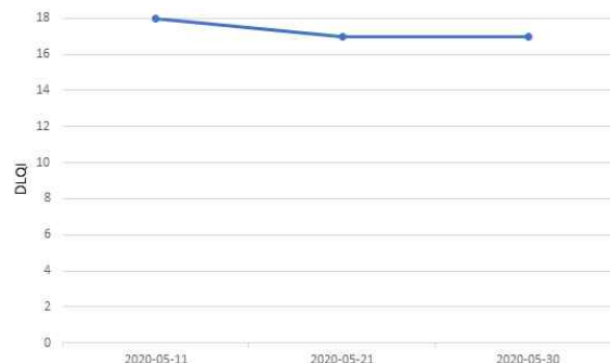
Fig. 3. Changes of dermatology life quality index (DLQI).

전신 소양감 및 발적과 열감은 입원 당시에 비해 30% 가량 호전을 보였고, 경부(頸部)의 소양감과 통증은 치료 2주차에 비해 변화를 보이지 않았다. 전신의 인설은 입원 당시에 비해 30% 가량 호전되었고, 팔과 다리의 두근거리는 박동감과 통증은 소실된 채로 유지했다.