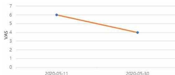
Fig. 4. Changes of visual analogue scale (VAS).