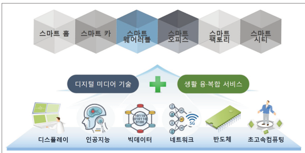
<그림 2> 디지털 라이프 서비스

현재 전세계인들은 코로나 감염 확산 방지를 위하여 타인과의 접촉을 최소화하기 위해 개인 공간에 갇혀 있게 되었다. 그러면서 자연스럽게 인간과 인간