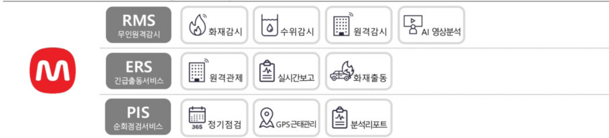
그림 2. M.Desk의 활용가능영역