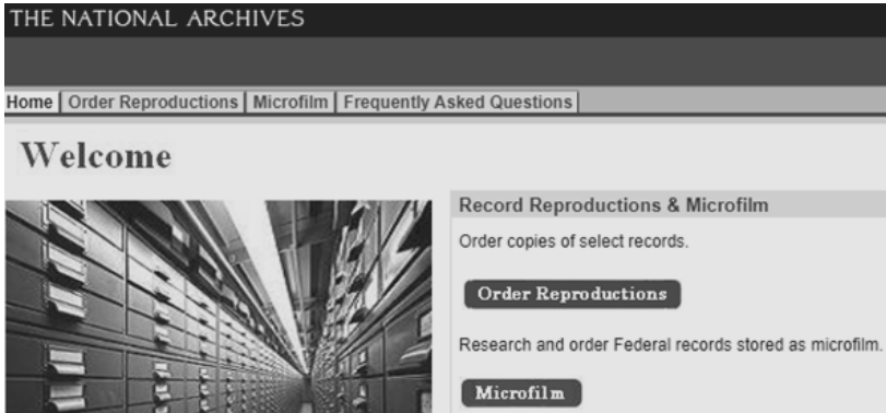
〈그림 2〉 미국 NARA의 가족역사 연구를 위한 기록 사본제공 서비스 화면

선박승선기록이라고도 지칭되는 이민기록(Immigrant Records)은 19세기부터 20세기 초반까지 5천만 명 이상의 이주민들이 선박을 통해 미국에 입국한 것과 관련된 기록이다. 따라서 이 기록은 조상의 국적, 출생지, 선박 이름 및 미국 입국날짜, 나이, 신장, 눈 및 머리 색깔, 직업, 최종 거주지, 미국에 기입국한 친인척의 이름과 주소, 입국 당시 소지한 화폐의 양 등 가족역사 연구에 유용한 정보로 활용이 가능하다. 5) 마지막으로 귀화기록(Naturalization Records)은 이들 이민자의 미국 시민권 획득과 관련된 기록으로 조상의 생년월일 및 출신지역, 직업, 이민년도, 결혼 여부 및 배우자 정보, 증인의 이름 및 주소 등과 같은 정보를 포함하고 있다. 6)