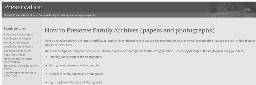
〈그림 1〉 미국 NARA의 가족아카이브 메인 화면

우선 가족기록의 예비 정리는 가족아카이브 구축을 위한 준비 단계로, 실제 기록을 예비적으로 정리할 때 유의해야 할 사항을 제시해주는데, 여기서는 가족기록을 정리하기 전에 우선적으로 청결한 공간을 마련하도록 권장하며, 또한 실제 기록물 및 사진을 다룰 때 유의해야 하는 사항들을 제시해주고 있다. 다음으로 가족기록의 보관 항목에서는 종이기록 및 사진자료