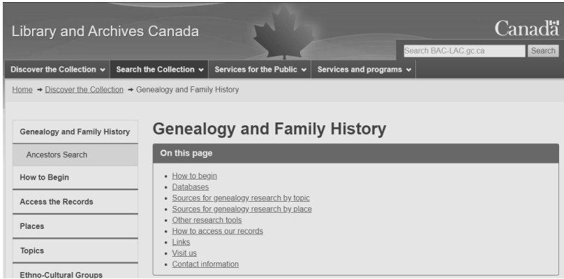
〈그림 6〉 캐나다 LAC의 가족역사 연구 서비스 메인화면

세례년도, 결혼년도, 사망년도 등을 통해 기록 및 데이터베이스 내에 존재하는 조상에 관한 정보를 검색할 수 있도록 하고 있다. 아울러 파악된 기록 및 관련 정보를 온라인 및 오프라인 방식으로 획득하는 방식에 대해서도 상세히 안내해주고 있으며, LAC 소장기록 외에 가족역사 연구에 도움이 되는 타기관 및 타사이트도 링크로 연결해주고 있다. 13)