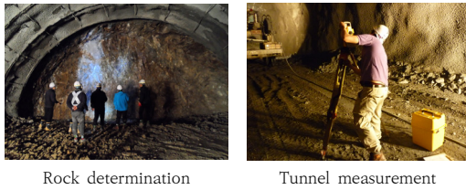
Fig. 2. Rock determination / Tunnel measurement