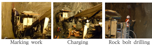
Fig. 4. Work by personnel specializing in tunnel excavation

조사결과 터널 전체 사이클의 전체 작업인력은 C군 터널 기준으로 현재기준인 9명 수준으로 조사되었으나, 작업반장과 화약취급공을 제외한 작업조당 3~4인의 전문인력(특별인부)이 기존의 보통인부를 대체하고 있는 것으로 나타났다.