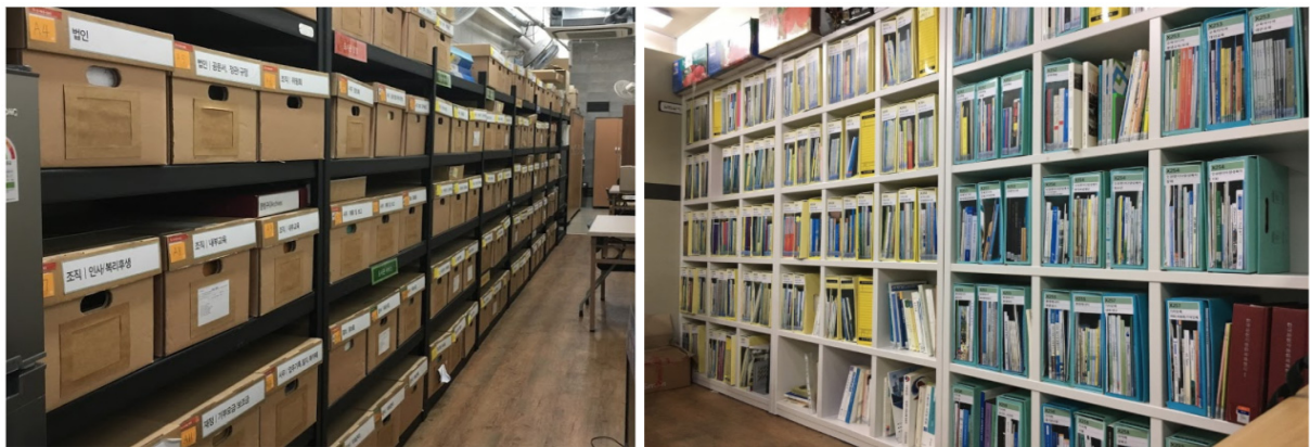
〈그림 1〉 기록보관실 아카이빙박스과 도서관계·커뮤니티 코너

이런 이유로 별도의 서가와 전시공간을 마련해두고 아카이브 자료 일부를 전시하고 있다. 그러나 이용자의 눈길을 끌 수 있는 지속적 관심과 관리가 필요한 상태이다. 마을에서 일어나고 있는 행사 등과 연계하고 마을 커뮤니티와 함께 전시를 기획한다면 보다 효과적으로 알릴 수 있는 기회가 될 것이다.