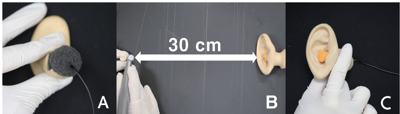
Fig. 1. (A) The portable microphone was connected to the inner ear of the model and the connection area was sealed with a sponge, (B) The level of noise was measured in various conditions from the distance of 30 cm with a portable noise mete, (C) Noise level was measured again after the application of noise cancelling devices.