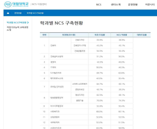
[Fig. 6] j Junior College NCS implementation status by department

j 대학은 학과별 NCS 구축현황을 퍼센트로 표기하여 NCS 지원사업 서비스를 제공하고 있다. 대학 내 학과별로 NCS 구축현황을 학과도입률, NCS 적용률, 대학도입률로 구분하여 제시함으로 대학 내 NCS 진행 상황을 웹서비스로 제공하고 있었다. 언급된 웹서비스는 [Fig. 6]에서 제시하고 있다.