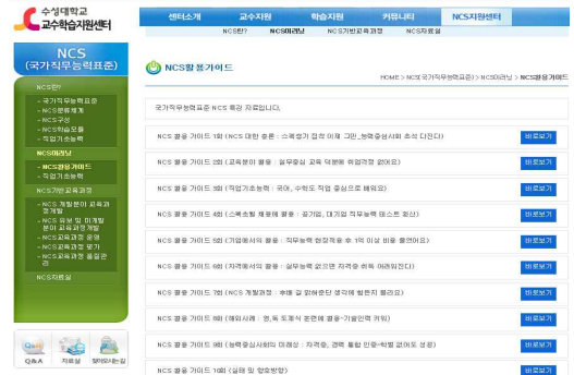
[Fig. 5] i Junior College Provide e-Learning Contents

i 대학은 NCS 지원서비스를 교수학습지원센터 홈페이지의 메뉴에서 제공하고 있다. 타 대학의 NCS 지원과 개념 및 교육과정 등은 유사하게 제공되어 있다. 차별화된 점은 NCS 활용 가이드와 직업기초능력을 이러닝 콘텐츠로 제공하고 있다. NCS 이러닝 메뉴에는 NCS 활용 가이드 동영상 콘텐츠가 10회차로 제공되고 있고 직업기초능력과 관련한 콘텐츠도 10회차로 제공되어 있다. 위 내용을 [Fig. 5]에서 제시하고 있다.