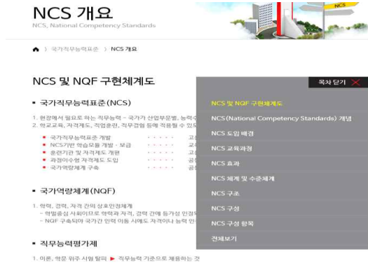
[Fig. 1] b Junior College NCS and NQF Implementation System Diagram

b 대학의 NCS 지원서비스 중 NCS 및 NQF(국가역량체계) 구현체계도 서비스는 b 대학만의 웹서비스로 확인된다. NCS에 관련 개념, 도입배경, 교육과정, 효과, 체계 및 수준체계, 구조, 구성, 구성항목을 상세하게 제시하였다. 해당 대학 교원 및 학생에게 NCS와 관련된 개념을 쉽게 이해할 수 있도록 웹서비스를 제공하였다. 위 내용을 [Fig. 1]에서 제시하고 있다.