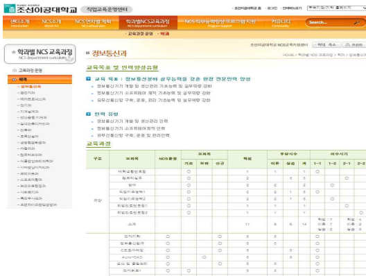
[Fig. 4] f Junior College NCS curriculum by department

f 대학은 학과별 NCS 교육과정을 NCS 지원사업 서비스로 제공하였다. 학과별 NCS 교육과정 웹서비스에는 교육과정 운영에는 f 대학의 교육과정개발 방법에 대한 웹페이지가 구성되어 있다. 학과 메뉴에는 학과별 교육목표와 인력유형, 교육과정, 로드맵, 직무능력완성도 평가로 구성되어 도식화된 이미지를 포함하여 상세하고 친절하게 제공되고 있다. 위 내용을 [Fig. 4]에서 제시하고 있다.