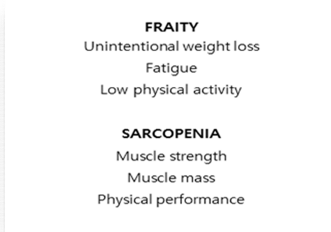
Fig 1. Criteria for the diagnosis of sarcopenia and frailty.

근골격계는 신경계의 지배를 받아 수의적 운동이 가능하다. 그러나 인체의 신경계 기능도 타 기관계와 마찬가지로 노화에 따라 감소하며, 기저핵, 소뇌, 및 전두엽 피질은 운동계획과 실행에 있어서 지배적인 역할을 한다. 기저핵과 소뇌는 주로 운동계획에 관여하는 반면 전두엽 피질은 운동의 조절 및 실행과 관련이 있으며, 이러한 구조들 사이의 피드백 루프(feedback loops)는 운동과 제어 역할을 담당한다(8). 기저핵은 노화중에 다른 뇌 부위와 비교했을 때 상당한 퇴행성 손실을 당하기 때문에 보상 기전으로서 전두엽 피질이 운동계획, 실행 및 조절을 위한 생성자로서 더 큰 역할을 맡는다(9). 그러나 전두엽 네트워크는 노화에 따른 운동 제어의 절충으로 인해 상당히 감소하고, 운동단위의 크기, 총량, 발화를 또한 감소하는 쪽으로 변화한다.