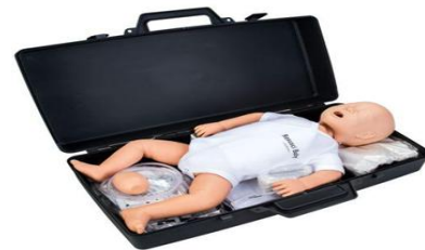
Fig. 4. Laerdal Resusci Baby Q CPR Manikin

본 실험의 1인 구조자 영아 심폐소생술의 질을 평가하기 위해 Laerdal Resusci Baby Q CPR Manikin(Laerdal Medical, Stavanger, Norway)로 실험 하였으며, 가슴압박의 깊이, 속도를 측정하였으며, 인공호흡의 성공여부의 데이터를 이용하였다[Fig. 4].