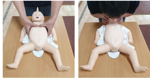
A. Over-the-head two-thumb encircling technique(OTTT)