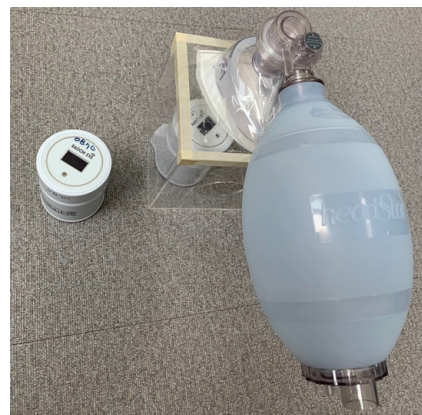
Fig. 2. The airtight container was manufactured.

성인의 폐활량인 약 4.5~4.8 L의 용량을 표현하기 위해 아크릴을 이용하여 밀폐 용기를 제작하였다. 가로 15 cm, 세로 15 cm, 높이 20 cm인 밀폐 용기에 지름 6 cm의 공기 주입구를 뚫었다. 이후 공기 주입구에 마스크를 부착한 후 앰부 백을 연결하여 일반적인 호흡 상황을 만들기 위해 분당 15회 공기를 주입하였다. Fig. 2와 같이 제작된 밀폐 용기 및 앰부 백을 연결하여 마스크를 통과한 공기의 라돈 농도와 마스크를 통과하지 않은 공기의 라돈 농도를 동시에 측정하기 위해 2대의 라돈 측정기를 이용하여 5시간씩 5회 측정 후, 라돈 측정기에 따른 오차를 줄이고자 측정기의 위치를 바꿔 2회 반복 측정하였다.