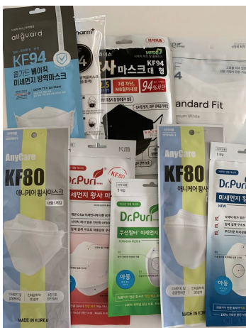
Fig. 1. Masks were used in the experiment.

일상생활에서 사용하는 마스크 종류에 따라 초미세먼지 차단 효과와 그에 따른 라돈 차단 효과가 비례하는지 측정하기 위해 Fig. 1과 같이 일반적으로 사용되는 일회용 마스크, 의료용 마스크, 면 마스크와 식품의약품안전처에서 인증한 마스크인 KF80, KF94를 사용하였다.