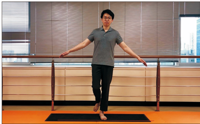
Figure 1. Measuring center of pressure (open eyes).

눈을 감았을 때 211.4 \pm 129.9 \text{ mm}^2 이었으며 건축의 압력 중심의 타원 영역은 눈을 떴을 때는 56.1 \pm 35.6 \text{ mm}^2 , 눈을 감았을 때 234.4 \pm 202.6 \text{ mm}^2 으로 나타났다. FAOS의 각 세부 항목은 통증 72.8, 증상 80, 기능 87.5, 스포츠 58.9, 삶의 질 42.9로 평균 68.42점이었다. 이에 대해 상관계수를 평가하였고 눈을 떴을 때 환측의 이동거리는 FAOS의 통증 항목에 대해 -0.394 ( p=0.038 ), 전체 평균 점수에 대해 -0.429 ( p=0.023 )였으며 타원 영역은 삶의 질 항목에서 -0.425 ( p=0.024 )의 유의한 음의 상관관계를 보였다(Table 2, Fig. 4). 반면, 눈을 감았을 때 측정된 압력 중심의 이동거리, 타원 영역은 환측에서 유의한 상관관계를 보이지 않았다( p>0.05 ).