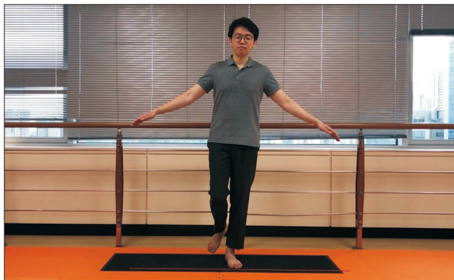
Figure 2. Measuring center of pressure (closed eyes).