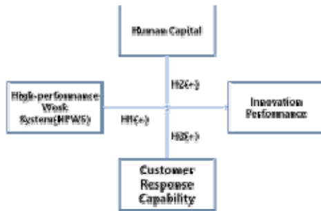
Fig. 1. Research model