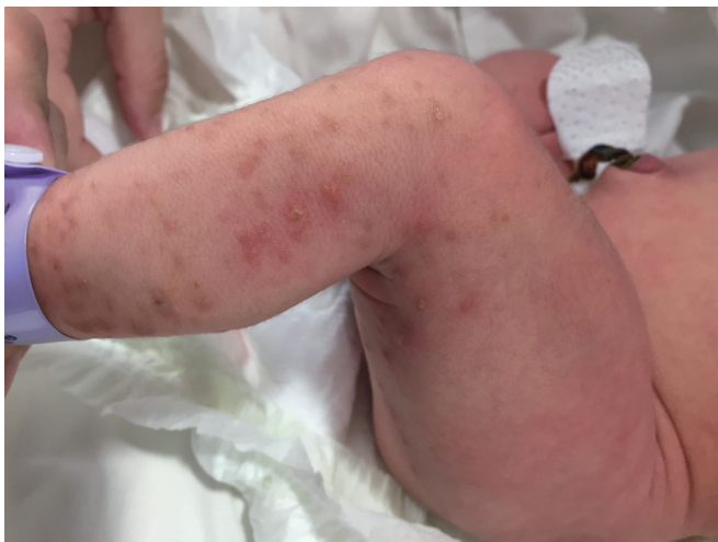
Figure 1. On the 4th day, clustered erythematous vesicles and light brown macules are visible along the Blaschko line on the left extremities.

퇴원 다음 날 다시 왼쪽 거드랑이와 왼쪽 종아리에 홍반 및 수포성 병변이 재발하여 생후 13일째 본원 신생아중환자실에 재입원하