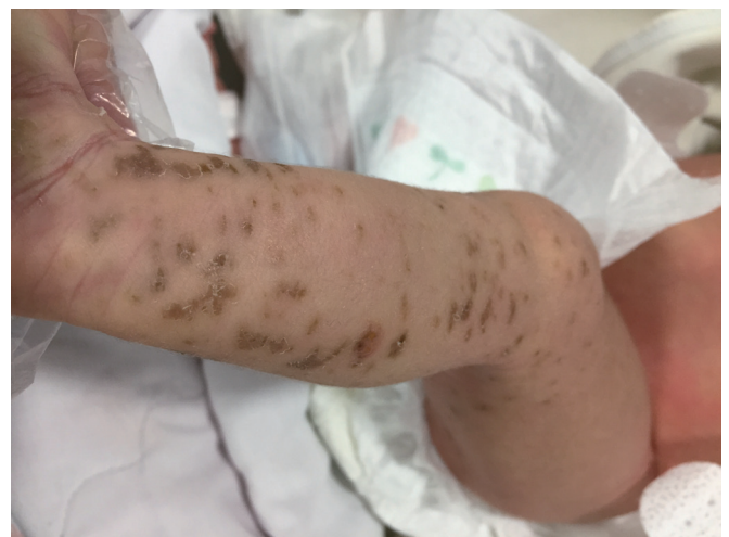
Figure 2. On the 11th day, blistered skin is replaced by crusts and dark brown colored pigmented macules on the left extremities.