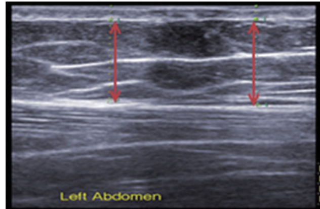
Figure 2. Axial ultrasound image for abdominal subcutaneous fat thickness.

자료수집은 Shim 등[12]이 일차 연구 때 사용했던 자료의 일부와 그 외 원 자료를 이용하고자 책임자에게 본 연구에 대해 요약된 계획서를 제시하고 자료사용에 대한 허락을 받았다. 원 자료의 수집 방법은 다음과 같다. 일반적 특성은 연구에 대한 서면동의를 받은 후 설문지를 이용하여 조사하였으며, 체중, 체질량지수, 허리둔부비율, 내장지방은 생체전기저항분석기를 이용하여 측정하였다. 복부내 부위별 피하지방두께는 초음파 촬영에 대한 자격증을 소지하고 임상에서 3년 이상 초음파 촬영을 경험한 2명의 초음파검사자(sonographer)가 복부 분할표에 따라 측정하였다. 측정방법은 다음과 같다. 초음파 탐식자에 젤을 바른 후, 인슐린주사 부위표에서 지정된 부위에 직각으로 놓고 해당조직이 눌리지 않도록 변환기를 피부에 가볍게 적용한다. 기본주파수는 10 MHz로 하였으며, 피하지방두께가 명확하지 않은 부위는 7-12 MHz범위 내에서 주파수를 변