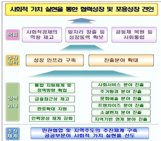
[그림 2] 사회적 경제 조직의 목표와 전략