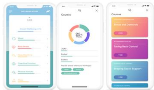
Fig. 4. BioBase App

다음으로 소개할 사례는 정신 건강 환자를 지원하기 위해 바이오비트(BioBeats)가 개발한 서비스로 바이오베이스(BioBase)이다. 바이오베이스는 2019년에 사용된 인공지능 정신 건강 앱 중에서 다운로드가 많이 된 앱 중의 하나로 이용자의 스트레스를 추적하고 측정 및 관리할 수 있는 앱 서비스이다. 이 앱을 통해 신체 스트레스를 측정하고 기분을 추적하고, 뇌 기능 검사를 받으며, 몇 주 동안의 스트레스를 관리하고 확인할 수 있다. 생체 및 심리 데이터를 추적하여 정신 건강에 대한 고유한 통찰력을 제공한다. 정신 건강 데이터는 데이터베이스 내의 데이터들과 비교되어 개인 웰빙 점수를 실시간으로 제공한다. 웰빙 점수는 심박수, 활동, 수면, 기분 및 인지 기능을 기준으로 측정된다. [Fig 4]는 Biobase 애플리케이션의 예시이다.