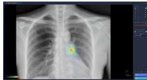
Fig. 1. Lunit INSIGHT CXR

주요 폐질환의 실시간 진단이 가능(Lunit INSIGHT CXR)하다. 흉부 X-선은 숙련도에 따라 판독 정확도 차이가 크기 때문에, 영상의학 전문의와 비영상의학 전문의 간 판독 정확도는 최대 30%의 차이를 보인다. 흉부 X-선 영상에서 폐 결절/종괴, 경화, 기흉 등으로 의심되는 이상부위를 검출하여 의사의 판독을 보조하는 소프트웨어인 Lunit INSIGHT CXR는 [Fig 1]와 같이 인공지능 알고리즘이 영상을 분석하여 (1) 병변으로 의심되는 위치를 색상(Heatmap)으로 표시하고, (2) 병변의 존재 가능성을 확률값(Abnormality Score, %)으로 나타낸다. 이 소프트웨어는 총 20만 장의 양질의 데이터를 학습하였으며, 주요 폐질환 검출 정확도가 98-99%에 이르며, 영상 판독 보조 시, 의사의 판독 정확도 최대 14% 향상될 것으로 예상된다.