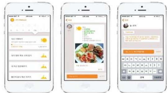
Fig. 3. NOOM App

에는 이용자에게 보냈던 코치들의 메시지를 데이터로 학습시킨 후에 인공지능이 직접 '메시지 코칭'을 하는 것을 도입하려고 하고 있다. 셋째, 축적된 데이터를 활용하여 고객의 타깃을 환자로 넓히고 있다. 당뇨, 비만 환자들의 경우 식단의 영양관리에 어려움을 느끼곤 하는데 이러한 환자들의 라이프스타일 데이터를 의사에게 리포트해주고, 데이터를 연결하여 식단을 효율적으로 관리할 수 있도록 한다[21]. [Fig 3]은눔 애플리케이션의 사용 예시이다.