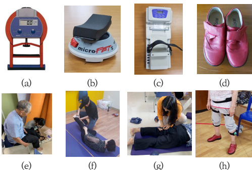
Fig. 1. Measurement devices and methods. (a) grip force dynamometer (b) muscle manual testing dynamometer (c) toe grip force dynamometer (d) inertia-sensor built-in shoes (e) toe grip force testing (f) gluteus medius testing (g) gluteus maximus testing (h) gait testing

모든 수집 된 통계 데이터는 SPSS/WIN 21.0(IBM Inc, USA) 통계프로그램을 이용하였다. 인구 통계학적 자료는 나이 구분(전기노인과 후기노인)을 요인으로 독립 t-검정을 실시하여 평균을 비교하였다. 대상자의 측정된 자료(악력, 발가락력, 중둔근력, 대둔근력, 보속, 보빈도, 보폭, 외발지지기, 양발지지기)는 독립 t-검정과 상관관계(Pearson's correlation) 분석으로 연령에 따른 주효과 및 전·후기 노인의 근력과 보행 특성의 관계를 살펴 보았다. 또한, 보속과 근력과의 관계(회귀계수)가 연령 수준에 따라 변하는지 파악하기 위해 보속을 종속변인으로 선형회귀 분석을 각각 실시하였다. 표준화된 회귀계수의 95% 신뢰수준에서 서로 교차되는 면적에 따라 유의성을 판별하였다[27]. 95% 신뢰수준을 얻기 위해 SPSS에서 부트스트랩(bootstrap) 옵션을 사용하였다. 모든 통계 과정은 유의수준 .05를 유지하였다.