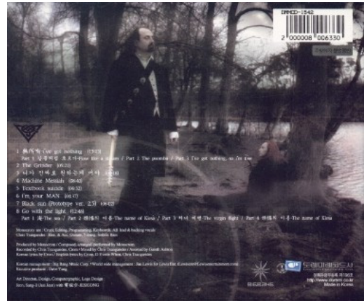
Fig. 3. MonoCrom Back

위의 앨범 자켓은 사전적 명사인 모노크롬(Monochrome)에 가까운 색채를 띠고 있는 것을 볼 수 있는데, 이것은 앨범에 수록된 작품들의 단순한 진행과도 연관성이 있는 것으로 사료된다. 수록된 작품들도 단조로운 진행이나 반복되는 구간들이 모노크롬(Monochrome)의 사전적 의미인 한 가지 색과 동일한 형태를 띠고 있다. 샘플링 사운드를 자주 사용하는 테크노 음악과도 모노크롬(Monochrome)의 사전적 의미는 이질감이 없어 보인다. 그는 이번 앨범에서 국악을 좀 더 확장적으로 사용하고 있다[5].