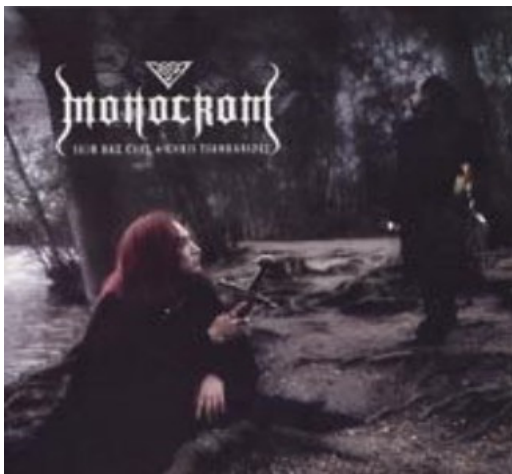
Fig. 2. MonoCrom Front