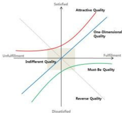
Fig. 1. Kano Model

제품과 서비스가 고객에게 전달되었을 때 느끼는 품질 수준이 충족할 경우 만족을 느끼지만 충족되지 않을 경우 불만족을 느끼는 것이 종래의 품질의 일원적인 인식 방법이다. 그러나 물리적 상황이 충분하지 못할 때 불만을 가지게 되지만, 충분하더라도 당연하게만 느낄 뿐 불만족을 가질 수 있다. 이처럼 인간에게는 두 가지 서로 다른 요구가 존재하며 이 다른 욕구가 인간의 행동에 영향을 미치는 영향이 다르다고 전제된 동기-위생이론을 바탕으로 품질의 이원적인 인식방법이 제시되었다[3]. Kano모델은 고객의 만족과 불만족이라는 주관적 측면과 물리적 충족과 불충족이라는 객관적 측면을 함께 고려한 품질의 이원적 인식방법으로 아래 Fig. 1과 같이 품질요소가 분류된다.