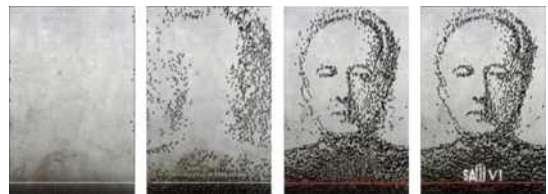
Fig. 3. <Saw6(2010)> Motion Poster.

Geeknation(2013)이 제안한 재생시간은 20초 이내였지만 반드시 지켜지지는 않았다. Fig. 1, 4, 5, 6,