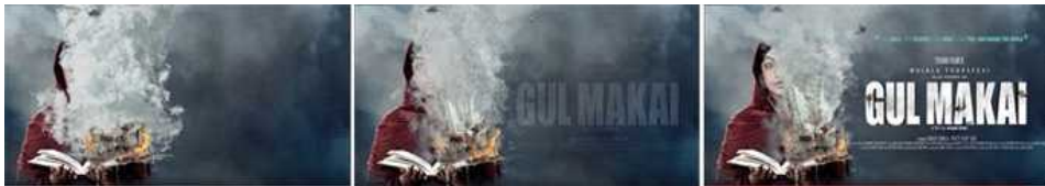
Fig. 9. <Gulmakai(2018)> Motion Poster.

볼터(Bolter)는 뉴미디어 형식이 등장할 때마다 자기보다 더 앞섰던 미디어를 차용하고 재구성하기 때문에 쉽게 이해되고 또 찬양받는다고 말했다[15]. 포스터를 포스터의 'Post'어원에 한정하여 기둥이나 벽에 붙여 홍보하는 광고물로 본다면 모션 포스터는 '포스터'라는 용어를 사용하기 부적절한 것으로 보인다. 하지만 모션 포스터는 인쇄매체 영화 포스터의