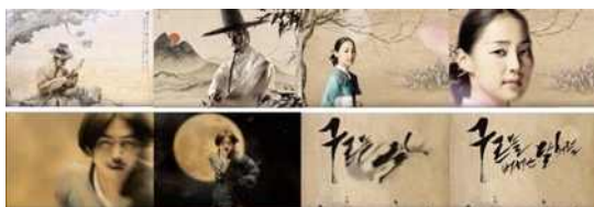
Fig. 2. <Blades of Blood(2010)> Motion Poster.

포스터 이미지에 약간의 움직임을 추가하는 방식을 사용함으로써 메인 비주얼을 비롯한 시각 요소들의 움직임의 정도는 트레일러, 티저 영상들과 구별되었다. 크게는 메인 비주얼을 비롯한 시각 요소들은 움직이지만 화면을 비추는 카메라 위크는 고정되는 경우, 반대로 시각 요소들은 멈춰 있거나 경미한 움직임을 보이고 카메라가 이동되는 경우로 나뉘었다. 예를 들어, 카메라와 장면이 고정된 경우 Fig. 1, 3, 4, 5, 6, 9 처럼 주제 요소가 이동(Fig. 3), 간단한 몸짓 혹은 회전(Fig. 1, 4, 5), 사라지고 나타나는(Fig. 6, 9) 등의 방식으로 움직인다. 화면을 비추는 가상의 카메라가 줌인 혹은 줌아웃, 회전, 이동 등으로 움직이는 경우 Fig. 2, 7, 10, 11처럼 포스터 내의 주요 인물과 소재는 고정된다.