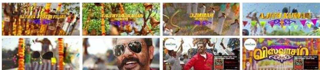
Fig. 11. <Viswasam(2019)> Motion Poster.