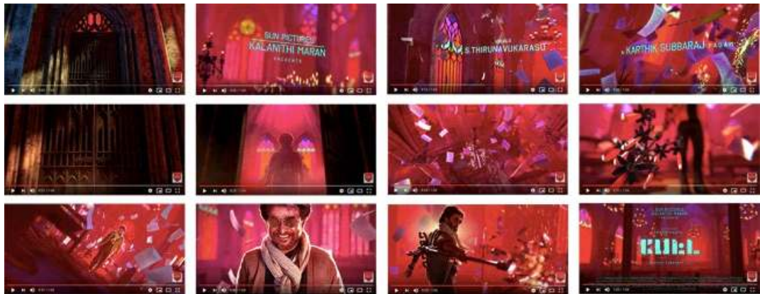
Fig. 10. <Petta(2019)> Motion Poster.