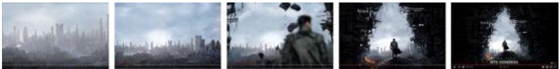
Fig. 7. <Star Trek into Darkness(2013)> Motion Poster.

그런데 최근 인도에서 제작된 모션 포스터들은 영상에 자주 사용되는 가로형 포맷, 1분 전후의 긴 재생시간, 카메라 이동을 비롯한 수차례의 장면 전환 등 '트레일러' 혹은 '티저' 영상과 큰 구분이 없어보인다. 즉, 3장에서 언급한 영미권에서 제작된 모션 포스터(Fig. 1, 3, 4, 5, 6, 7)와 인도에서 제작된 Motion poster(Fig. 9, 10, 11)들의 경우 포스터의 메인 비주얼, 움직임 등의 방식은 유사했지만 관형, 재생시간, 장면전환 횟수 부분에서 차이를 보였다. 인도권 모션 포스터 중 영미권의 모션 포스터와 유사한 형식인 경우도 있었지만(Fig. 9) 대부분은 20초를 2배 이상 뛰어 넘는 긴 재생시간과, 긴 재생시간만큼 빈번한 카메라 이동과 장면 전환이 특징적이었다. <Viswasam(2019)>의 모션 포스터는 재생시간 47초였고, Fig. 11에서 보듯 다양한 장면 전환이 있었다. 이러한 특징은 <Petta(2019)>의 Motion Poster(Fig. 10)도 마찬가지였고 재생시간은 1분 4초였다..이외에도 Motion Poster 연관 검색어 상위권인 인도 영화들 <Kodi(2016)>, <Pk(2014)>, <Singam3(2016)>, <Remo(2016)>의 Motion Poster들도 평균 50초 내외의 긴 재생시간, bgm 사용, 다양한 비주얼 요소 사용과 카메라 이동, 수차례의 장면 전환을 보이며 Geeknation 기반의 Motion Poster와 구별되는 인도권 Motion