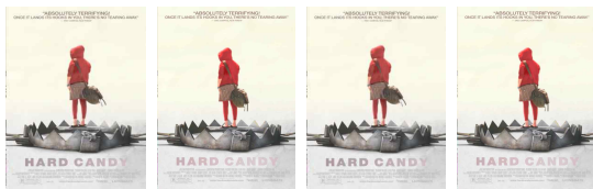
Fig. 1. <Hard Candy(2005)> Motion Poster.