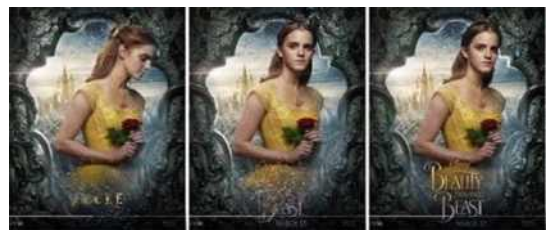
Fig. 4. <Beauty and the Beast(2017)> Motion Poster.