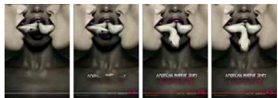
Fig. 5. <American Horror Story: Coven(2017)> Motion Poster.