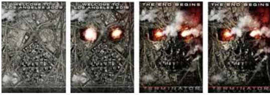
Fig. 6. <Terminator4(2009)> Motion Poster.

9는 20초 이내였지만, Fig. 3은 28초, Fig. 7은 41초로 다양한 분포를 보였다. 심지어 Fig. 10, 11를 비롯한 인도에서 제작된 모션 포스터들은 대부분 1분 전후의 재생시간으로 제작되었다. 사운드는 BGM이 포함되거나(Fig. 2, 3, 4, 6, 7, 9, 10, 11) 포함되지 않는 경우(Fig. 1, 5) 모두 존재했다. 20초를 넘는 긴 재생시간의 모션 포스터에서는 BGM은 대부분 포함되었고 나레이션이 포함된 경우도 있었다(Fig. 7, 9, 10). 이는 모션 포스터가 트레일러나 티저 영상과 비교하여 움직임이 단조로운 특성을 지니고, 20초가 넘어가는 등 재생 시간까지 길어질 경우 감상자의 흥미 감소를 방지하기 위해 사운드를 사용한 것으로 보인다.